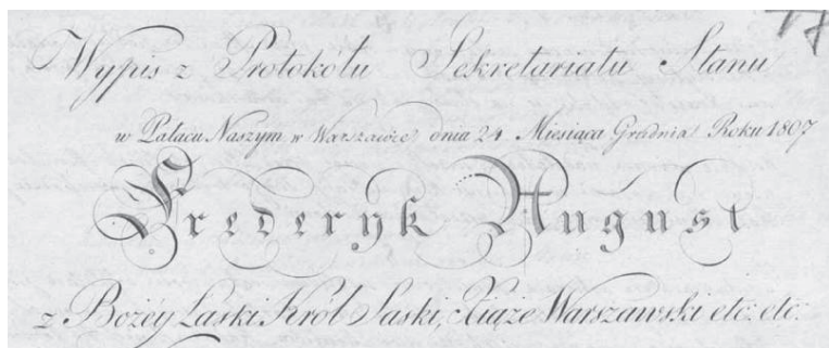
Rysunek 6. Nagłówek urzędowej kopii dekretów królewskich